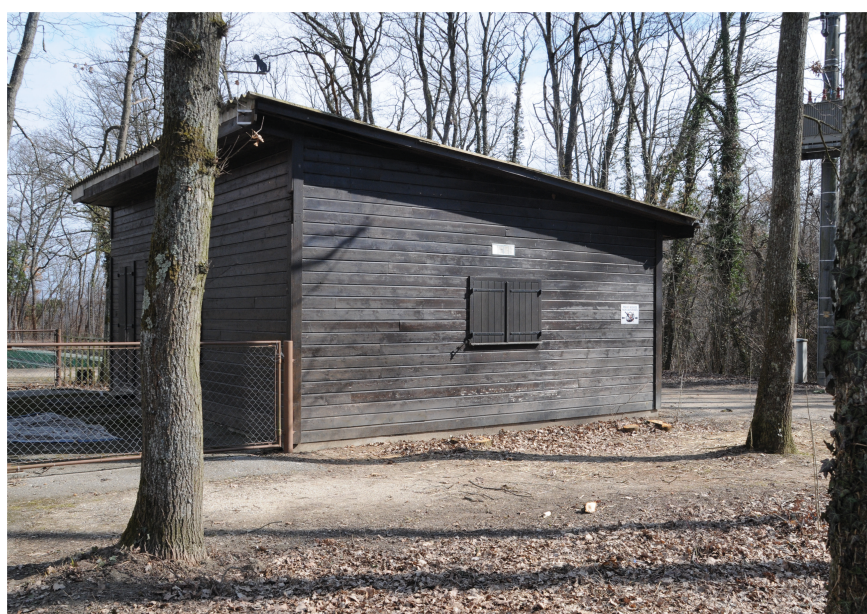
Le chalet rustique a été construit à l'époque du golf. Ici avant sa rénovation en 2010 pour permettre sa mise en location au public.