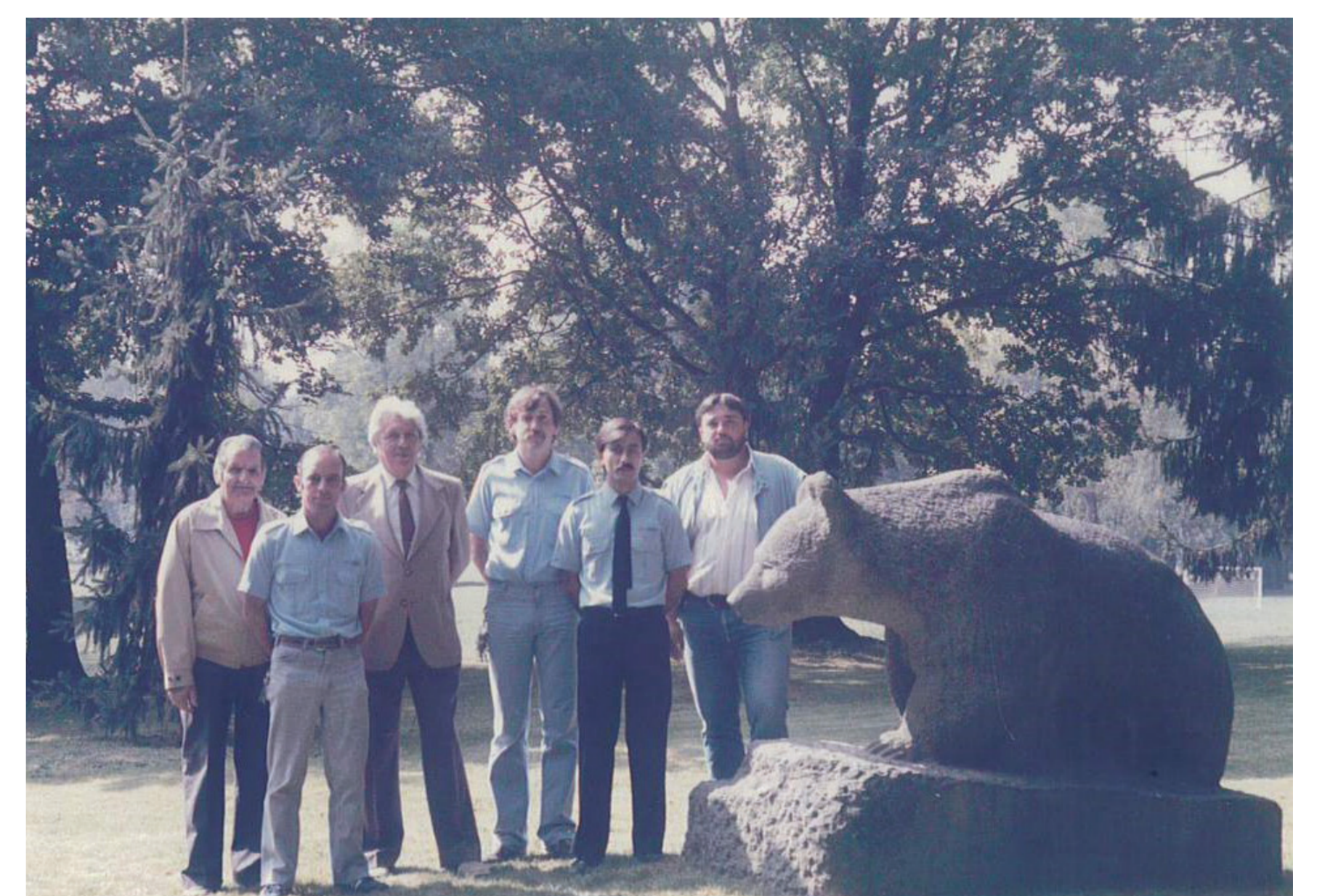
Inauguration de la sculpture de l'Ours de Robert Hainard en 1985