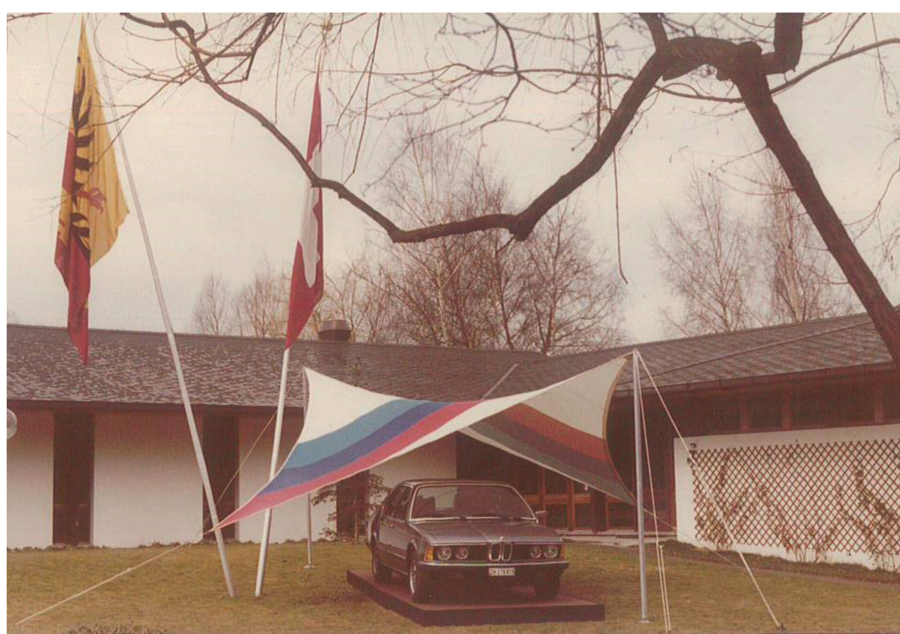
Stand d'exposition du salon de l'auto aux Evaux

Le groupement intercommunal se transforme en Fondation de droit public en 1982. Celle-ci est constituée des cinq communes membres (Bernex, Confignon, Lancy, Onex et Ville de Genève) ainsi que de l'Etat de Genève. Les charges d'exploitation et d'investissement sont réparties entre les cinq communes, l'Etat octroie quant à lui un droit de superficie sans contrepartie autre que la mise à disposition gratuite des infrastructures sportives aux écoles du Canton et services de l'Etat. L'administration est rattachée à la commune d'Onex jusqu'à ce que la Fondation prenne son autonomie en 2016.