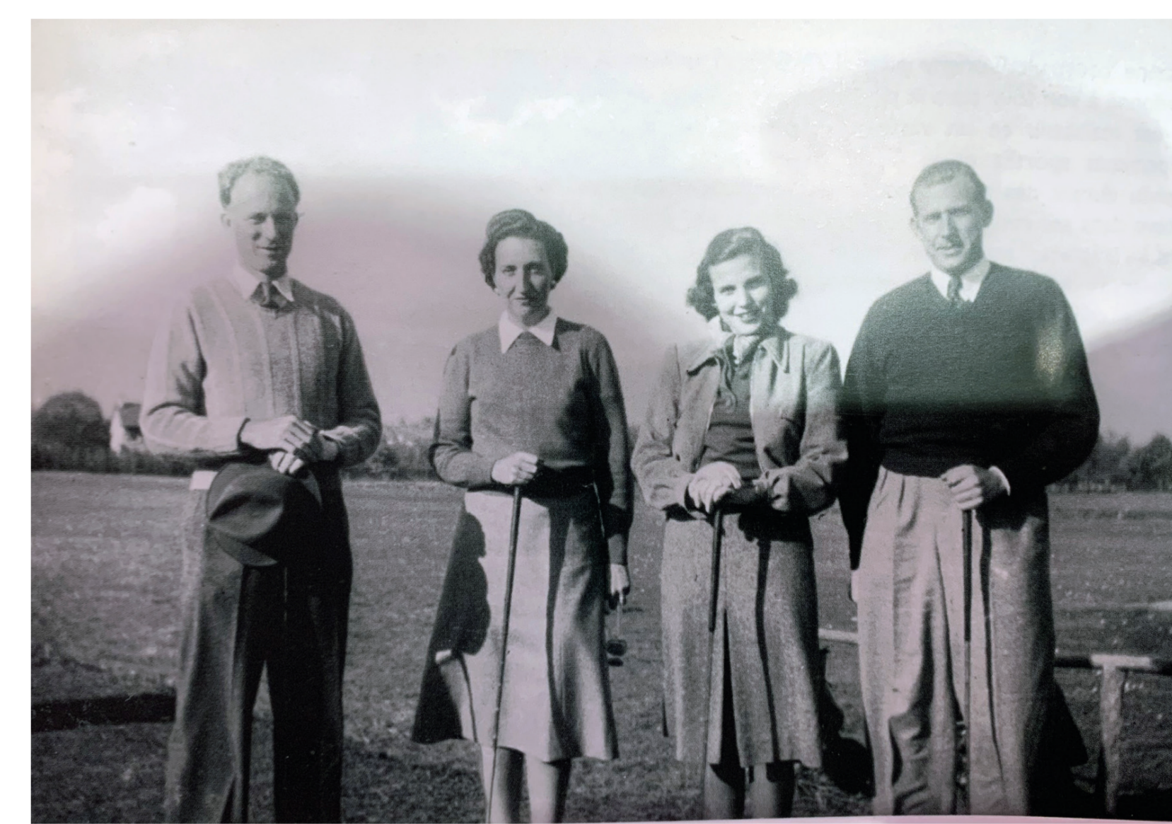
Roi des Belges Léopold III, Princesse de Rethy, Comtesse et Conte de Barcelone au golf d'Onex

Le mot Evaux est issu du pluriel de «Val» comme «vallon». Il caractérise la situation entre les deux «vaux» du nant des Evaux et du nant des Communes. La terminologie «des vaux» s'est transformée ensuite en «à l'Évaux» puis en «Evaux». C'est d'ailleurs pour cette raison que Evaux s'écrit sans accent sur le «E».