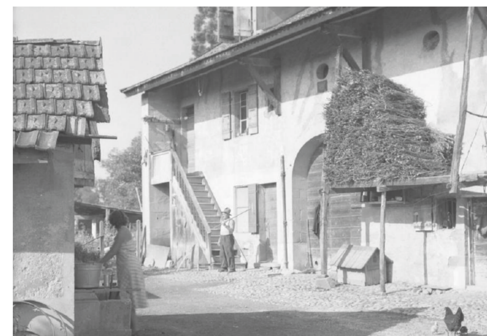
Les Evaux : extérieur de la ferme

Le parcours étant clôturé, les riverains du golf n'ont que peu accès à cette infrastructure ou seulement en faisant office de « caddies ». Le golf se développe jusque dans les années 60 avec la construction, en 1965, du nouveau Club-house, actuel bâtiment principal du Centre. Il déménage en 1969 à Cologny pour y rester jusqu'à ce jour.