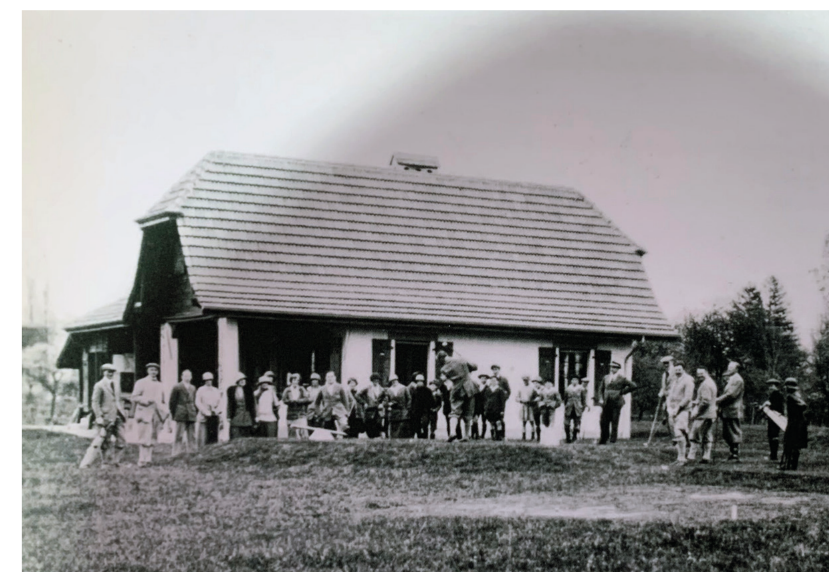
Le club-house du golf d'Onex en 1923